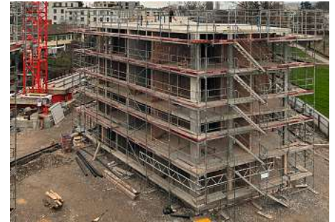
Auf dem Webcambild sind die viergeschossigen Gelenkbauten der Buchwiesen bereits gut erkennbar.