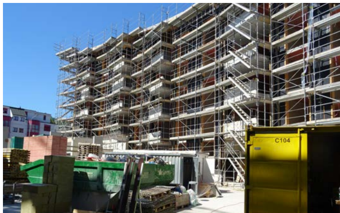
Ersatzneubau Schuppis II - die Fassadenelemente werden angebracht.