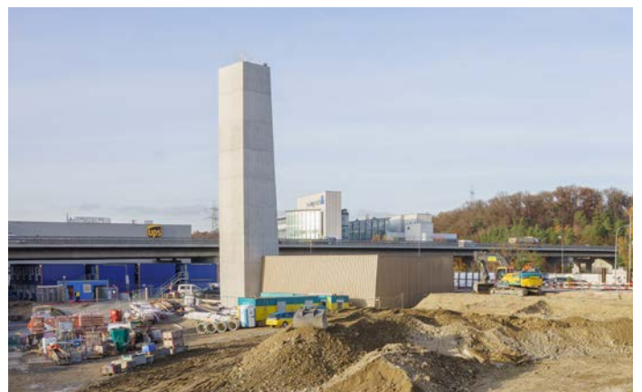
Glasi-Quartier Bülach - Holzschnitzelanlage.