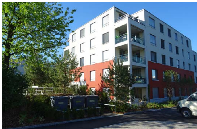
Ersatzneubau Birchstrasse - die Wohnungen wurden bereits bezogen.

Wie bei jedem Neubau sind Mängelbehebungstage geplant, welche nach den Sommerferien stattfinden werden. Die betroffenen Mieter wurden mit einem Schreiben informiert.