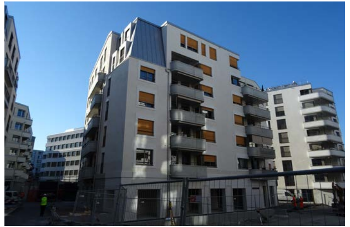
Glasi-Quartier Bülach - Aussenraum.

Diese Projektierungsarbeiten sowie diejenigen der neuen Anwendung der Lärmschutzverordnung werden weiter vorangetrieben, um die Einflüsse auf unser Gesamtprojekt möglichst frühzeitig einfließen zu lassen.