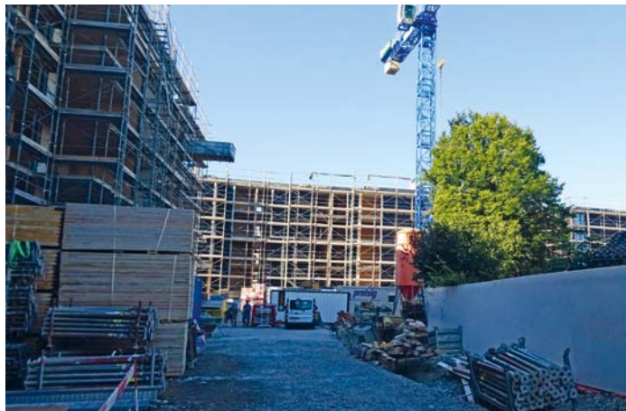
Ersatzneubau Riedacker - der Rohbau ist beendet.

MD, KW, CG. Nach dem Baubeginn im 2021 befinden wir uns nun in der Bau-Halbzeit. Der Rohbau ist beendet und die Holz-Aussenwände samt Fenster sind eingebaut. Dies wird am Bau-Aufricht-Fest am 16. September 2022 gefeiert. Ab Oktober 2022 konzentrieren sich die Bauarbeiten vermehrt auf den Innenausbau. Grundputze, Bodenisolierungen sowie Bodenheizungen und Unterlagsböden werden an- und aufgebracht. Gleichzeitig wird an der Haustechnik, wie Elektro, Sanitär und Heizung/Lüftung weitergearbeitet.