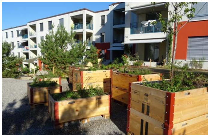
Ersatzneubau Birchstrasse - Hochbeete im Innenhof.

Auch hier gibt es erfreuliche Nachrichten. Die Baubewilligung über beide Etappen wurde erteilt und die Rekurs-Frist ist ohne Eingabe ebenfalls abgelaufen. Demzufolge ist die Baubewilligung rechtskräftig. Vor Ort werden die frei werdenden Reiheneinfamilienhaus-Typen nach Schadstoffen geprüft. Es wird ein Schadstoff-Bericht erstellt, den wir für die Baufreigabe benötigen. Anschliessend beginnt im Oktober 2022 die Schadstoff-Sanierung in der ersten Etappe.